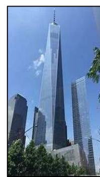
One World Trade Center

Il fait partie de l'ensemble de 19 bâtiments du Rockefeller Center.