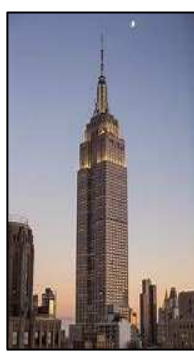
Empire State Building

Célèbre pour sa pointe en flèche. Il comprend 34 ascenseurs.